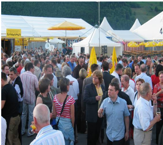
Eröffnung der iheimisch05

Aber was machte diesen Erfolg aus? Dass hier Profis am Werk waren, konnte man schon in der Vorbereitungszeit feststellen. Über 5'000 Stunden OK-Arbeit haben die Verantwortlichen investiert. In der technischen Planung und den Bauten, im Bereich Unterhaltung und der Kinderbetreuung, im Standbau und der Werbung, überall fand man solide Konzepte und Budgets vor. Nichts wurde dem Zufall überlassen. Noch zuversichtlicher wurde das OK dann am Eröffnungstag, als die Wetterprognosen auf „Schönwetter“ standen. 262 Aussteller aus Nidwalden und Engelberg präsentierten ihre Dienstleistungen und Produkte. Erst jetzt, nach der Aufbauphase wurde sichtbar, welche Anstrengungen nicht nur durch die Organisation, sondern auch durch die Aussteller selbst unternommen wurden, um die iheimisch 05 zum Erfolg zu führen.