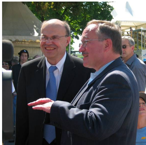
Bundespräsident Samuel Schmid im Gespräch mit Regierungsrat Gerhard Odermatt

Ein Garant für den Erfolg war aber auch der gewählte Standort. Das Areal des Flugplatzes Buochs/Ennetbürgen bot beste Voraussetzungen für einen Grossanlass dieser Art. Natürlich reichte es nicht aus, einfach nur viel Platz zu haben. Die Installationen für Infrastrukturen wie Strom, Wasser und vieles mehr mussten herangeschafft werden. Hier konnten die Organisatoren auf die Unterstützung des EWN, des BABLW und auch auf die ausserordentlich grosse Hilfe des Zivilschutzes zählen.